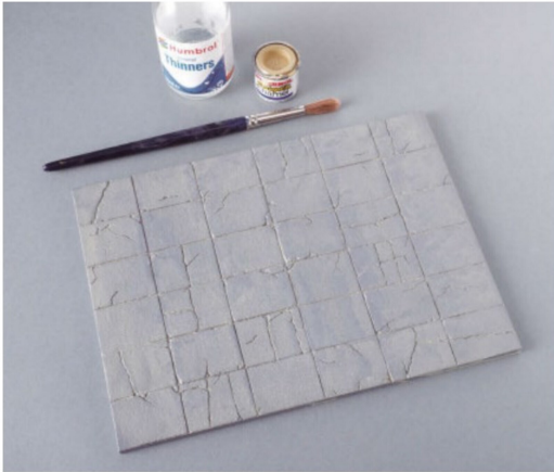
Ein erstes «Washing» mit stark verdünnter Sandfarbe und einem saugfähigem grösseren Pinsel.