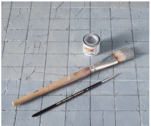
Trockenmalen und Kaschieren von weiss gebliebenen Stellen mit Hellgrau.