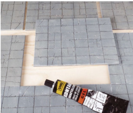
Am einfachsten und wirkungsvollsten geht die Montage mit Kontaktkleber.