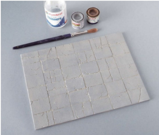
Ein weiteres Washing mit Hellgrau und Erdbraun. Die Farben werden sehr verdünnt angemischt.