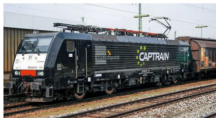
Die Lok ES 64 F4-111 von Captrain.