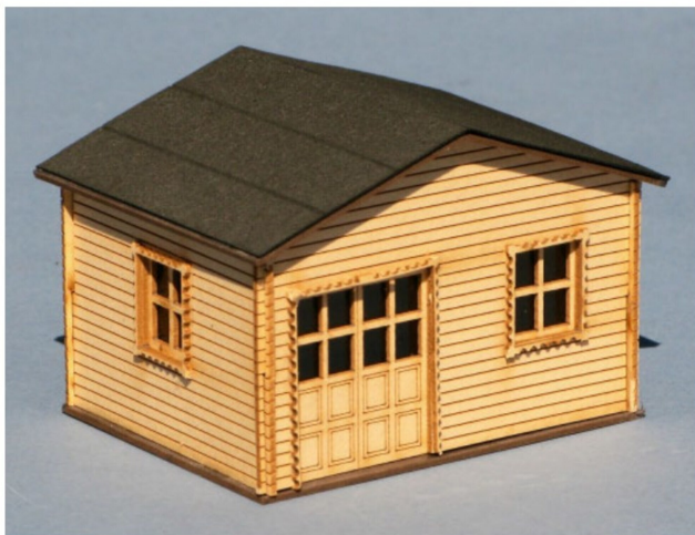
Der zusammengesetzte Bausatz mit provisorisch aufgesetztem Dach, vor der Farbgebung.