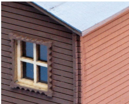
Diese Detailaufnahme zeigt den sehr guten Effekt des Holzbaus mit den ausgelasteten Holzteilen. Holzteile im selben Farbton bearbeitet.