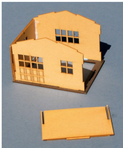
Die Wände sind teilweise zusammengesetzt.