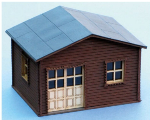
Das Gebäude wurde teilweise eingefärbt, später wurde entschieden, alle Holzteile im selben Farbton zu bearbeiten.