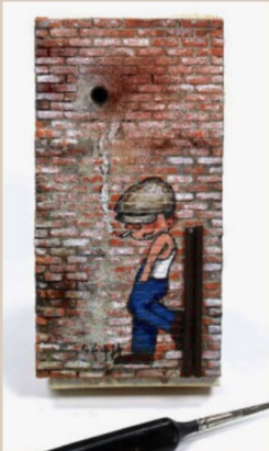
... feinen Pinsel bemalt und mit ...