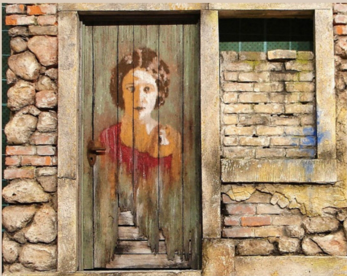
Eine solche Keimzelle stellt bereits ein etwas anspruchsvolleres Übungsstück dar.