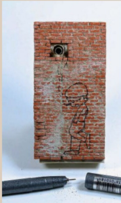
... eine Zeichnung, die mit einem ...