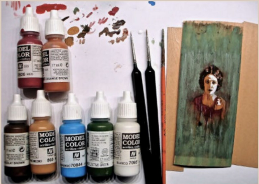
Quotenkorrekt: Ein Frauenporträt auf Holztüre.