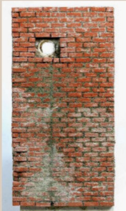
Dieses Mauerstück erhält ...