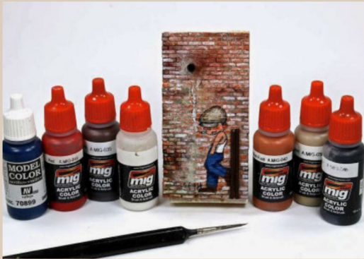
Das Angebot an Acrylfarben ist gross.