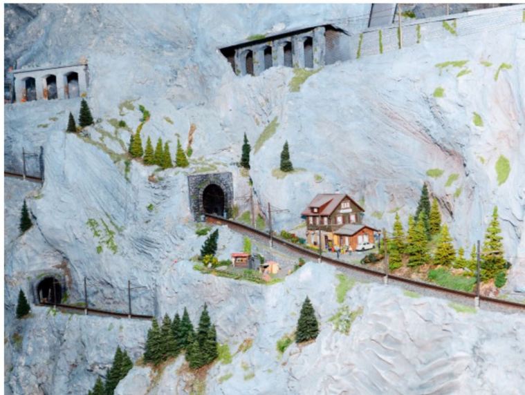
Meterspurbahnen, teilweise auch mit Zahnradstrecken, bilden einen Kontrast zu den Hauptstrecken.

Seit nunmehr 15 Jahren ist der MCH jetzt mit dem Bau der Grossanlage im Kirchmättli beschäftigt und hat gewaltige Leistungen vollbracht. Bis zum geplanten Vollbetrieb und der optischen Fertigstellung des Werkes ist noch die eine oder andere Parforce-Leistung erforderlich. Wir sind gespannt, wie das Ganze in wenigen Jahren aussehen wird, zuversichtlich darf man sicher sein.