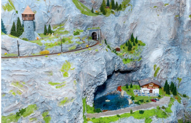
Die fertig gestalteten Ecken des grossen Bauwerkes zeigen schon sehr deutlich auch die Liebe zum kleinen Detail.