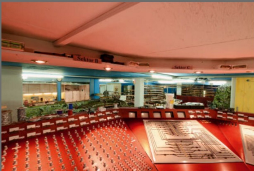
Dass hier etwas los ist, erhellt nur schon aus den vielen Bedienelementen.