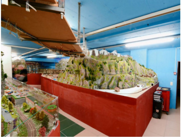
Durch solche Überführungsbauwerke wird vermieden, dass man «unten durch» muss beim Besuch.