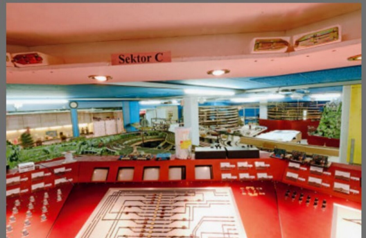
Die Übersicht auf den Betrieb der Anlage ist durchaus gegeben.