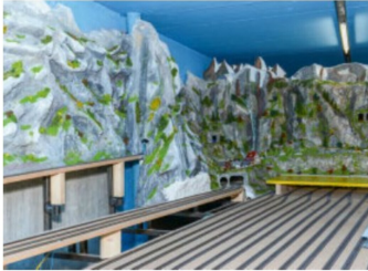
Bereits teilweise modelliertes Gebirgsmassiv.