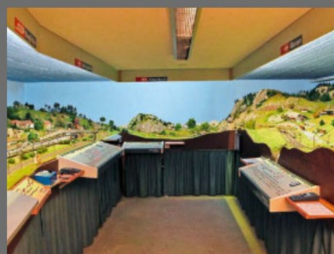
Blick Richtung Katzenbach, rechts Wassen.