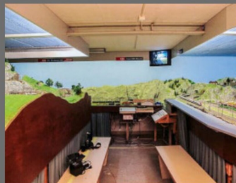
Die Gegenrichtung, rechts Burgfelden.