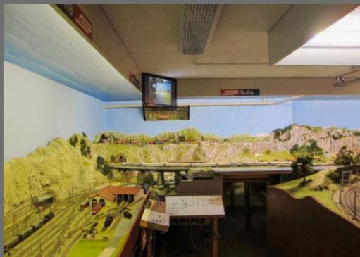
So tritt der Besucher in den Anlagenraum: Links der Bahnhof St. Muhrthal.