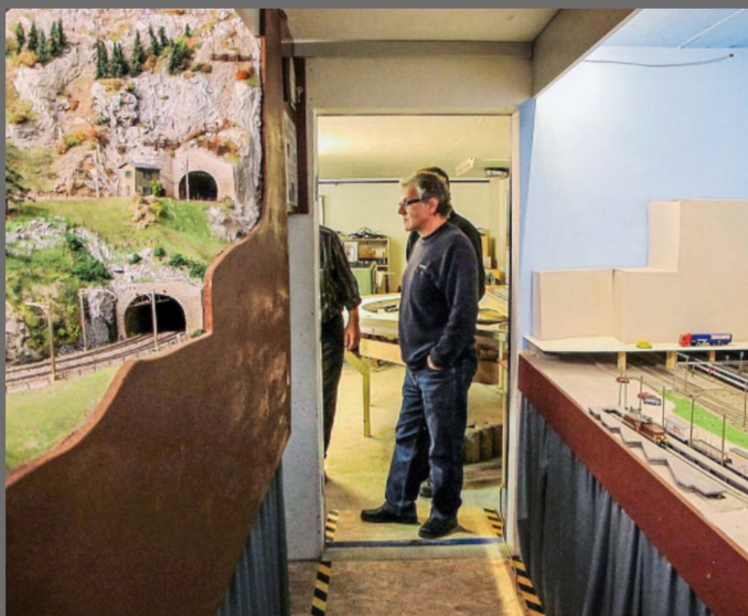
Hinter dem Bahnhof St. Muhrthal ist ausserhalb des Anlagenraumes die Wendeschleife sichtbar.