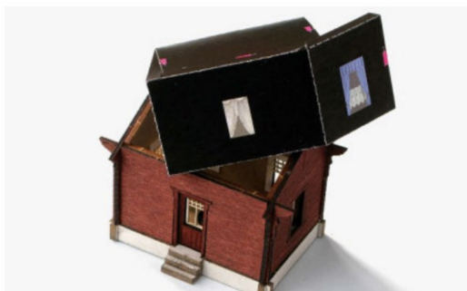
Nach dem Einbau der Fenster, werden die Vorhänge innen eingebaut, nachdem diese zusammengeklappt worden sind.