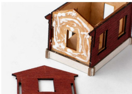
Klebstoff wurde auf die Grundwand angestrichen, jetzt kommt die Wand auf den Grundkörper.