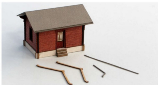
Nach dem Aufsetzen des Daches wurden die Dachrinnen montiert, die Dachendteile können jetzt angebracht werden.