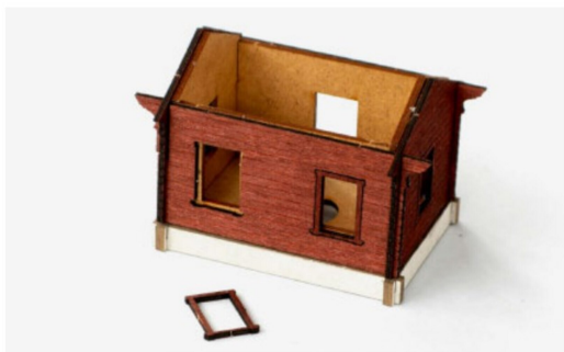
Das rechte Fenster wurde bereits eingesetzt, das linke wartet noch auf die Montage.