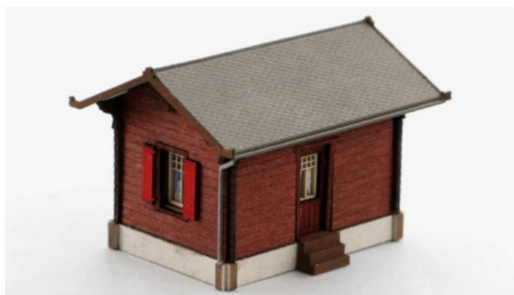
Hier ist der fertige Bau nach dem Anbringen der Dachdetails, der Treppenstufen und der Fensterläden.