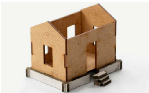
Der Gebäudegrundrahmen wurde eingesetzt und die Treppe angesetzt.