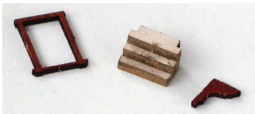
Die Treppenstufen, ein Fensterrahmen und ein Teil der Dachverzierung wurden herausgeschnitten.