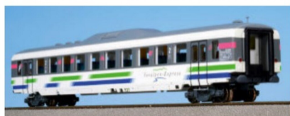
Voralpen-Express: Das Handmuster des ...

Weitere Infos: www.langmesser-modellwelt.de