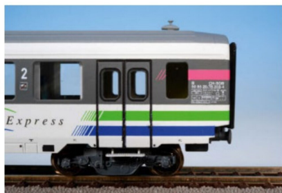
... Zweitklasswagen überzeugt und soll die ...