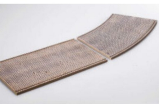
Pflasterstrasse für 0-Anlagen.

Aster bringt das SBB-Tigerli als spritzgeformtes Einstiegsmodell in Bausatzform.