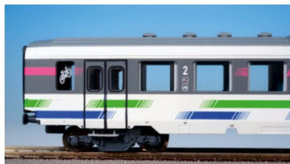
... klassische, fünfteilige Komposition ankünden.