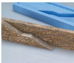
Natursteinmauer mit Treppe H0.