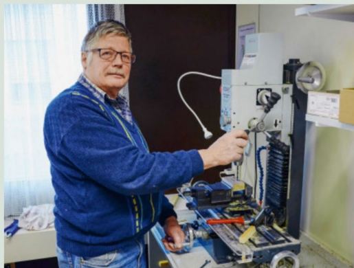
Hier an dieser Koordinatenfräsmaschine entstanden die ICN-Teile.