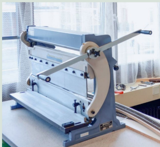
Das Handwerk mit Metallbearbeitungsmaschinen beherrscht der Hausherr wie die Bedienung der Holzbearbeitungsmaschinen in der nahen Schreinerei.