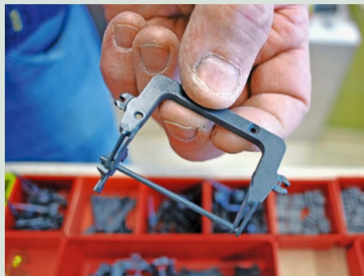
Selbst gefräste Teile der Drehgestelle für den ICN der SBB.