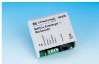
Neuer MARCo-Empfänger von Uhlenbrock.