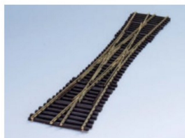
Das feine Weinert-Gleis erhält eine DKW.

eingestellt als Postbus bei einem privaten Post- autohalter in Goldach.