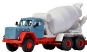
Drehendes: Betonmischer mit Drehtrommel.