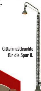
Gittermastleuchte für die Spur 0.

Für die Spur 0 gibt es neu einen Gitter- mast mit LED-Licht sowie eine Fahr- diensteleiterfigur, welche die Abfahrts- kelle hebt und senkt.