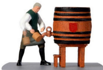
Bewegendes: Schankwirt beim «Ozapft ist!»