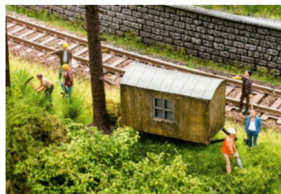
Set für eine kleine Baustelle.