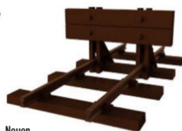
Neuer Prellbock für H0e.

Für die Spur 0 ist neu eine Weiche im Programm mit 22,5 Grad Abzweigwinkel, Radius 1028 mm.