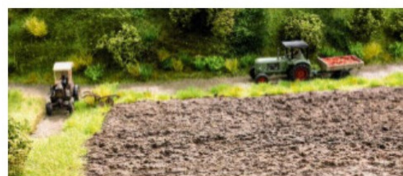
Frisch gepflügter Acker als fertige Matte.

Aus dem Sortiment von Woodland Scenics ist besonders das neue Beleuchtungssystem zu erwähnen, das verschiedene Lichteffekte in Häusern ermöglicht. Es ist auch auf bestehenden Anlagen mit Häusern leicht einsetzbar und fast unbegrenzt erweiterbar.