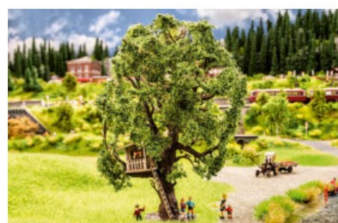
Das Baumhaus erinnert an die Bubenzzeit.