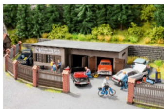
Hinterhof-Werkstatt «Schrauben Karle».