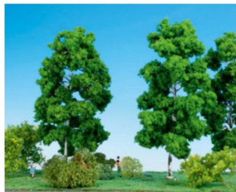
Neue Birken aus der Oberpfalz.

Der bayerische Modellbaum-Hersteller war dieses Jahr mit zwei neuen Birken aus der Oberpfalz nach Nürnberg gereist. An einem kleinen Stand präsentiert er traditionsgemäss sein Lieferprogramm.