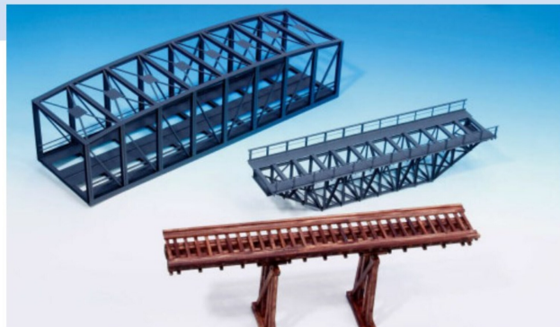
Zu den zahlreichen Brücken aus Weissmetall gesellen sich neu auch Modelle aus gelasertem Holz.