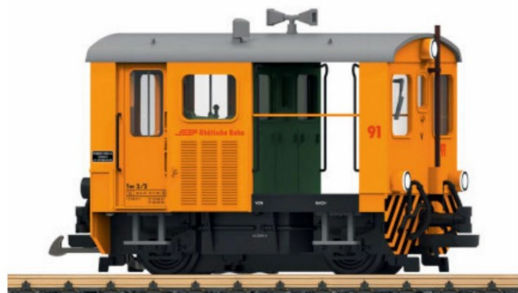
Rangiertraktor Tm 91 mit Rolltoren.