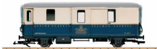
Gepäckwagen für den «Alpine Classic Pullman Express». Zusammen mit ...