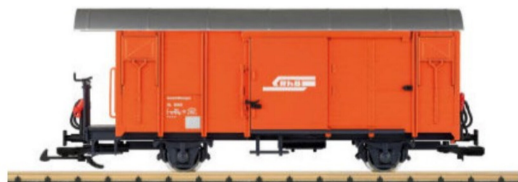
Zusatzhilfswagen Xk für den Baudienst.