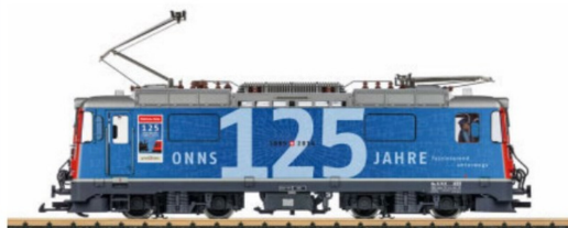
Ge 4/4 I im Festkleid aus dem vergangenen Jubiläumsjahr.