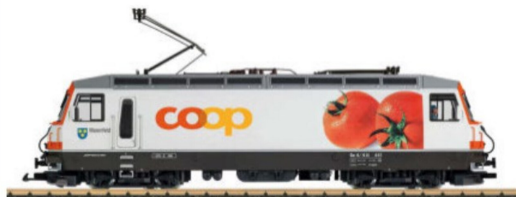
Ge 4/4 III neu mit dem Tomatenmotiv von Coop.