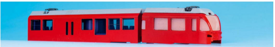
Nicht auf Modellbahn-Päpste hören: Der Zwitter-Normalspur-1:150-9mm Spurweite-GEX hatte grossen Erfolg. Ihm wird dies vermutlich auch blühen.

sein. Da sage noch mal einer, Kato höre nicht auf den europäischen Markt. Die rührigen Japaner haben offensichtlich Gefallen an dem Thema gefunden, da sind wir doch gespannt, wie es weiter geht. Das Allegra-Modell soll ab Mitte des Jahres 2015 bereits greifbar sein.