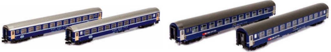
Die Liegewagen RIC Bcm kommen in zwei je zweiteiligen Sets mit altem und neuem (Alpen-Express) Logo.