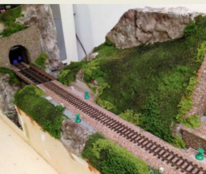
Immer ein motivierender Moment: Es wird farbig!