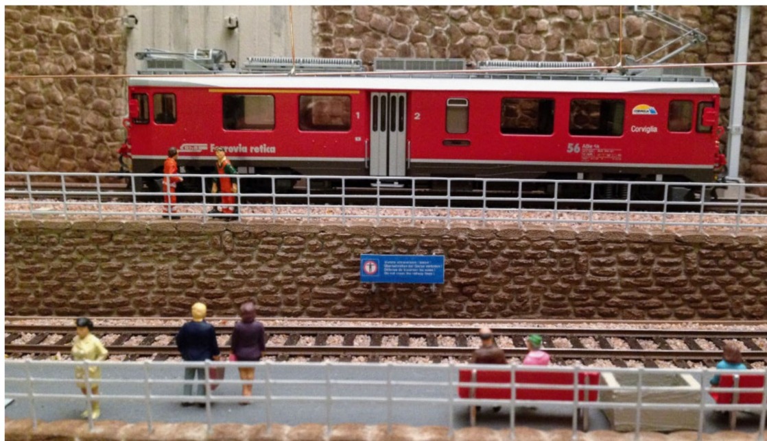
Das verbotene Überschreiten der Gleise würde auch kaum Sinn machen, denn auf dem Bahnsteig ist eh der bessere Standort fürs «Train-Watching».