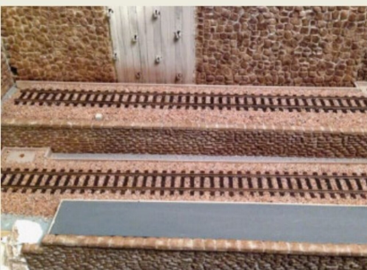
Raffiniert sind die unterschiedlichen Gleishöhen.