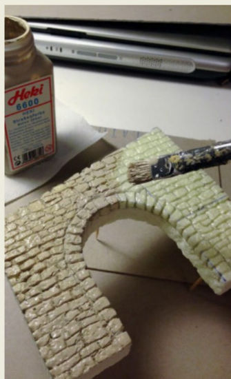
Dazwischen eine Trainingseinheit Kolorierung.