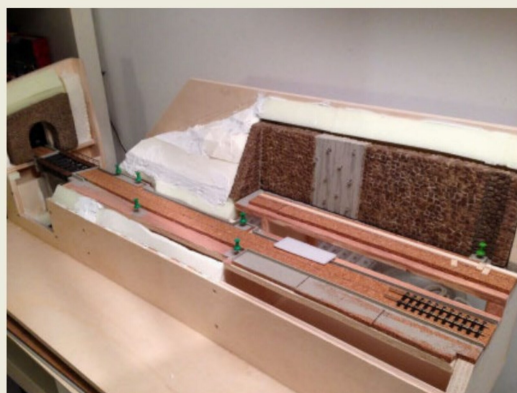
Langsam wird das Zusammenspiel zwischen Gelände und Gleis erkennbar.