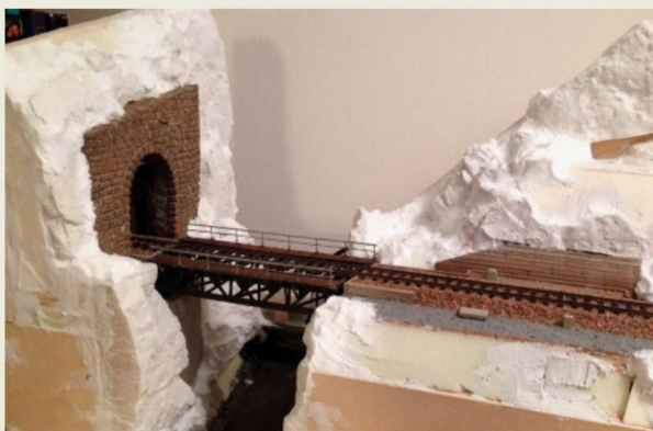
Die Dramatik durch felsiges Gelände will durch Gipsarbeiten erkaufte sein.