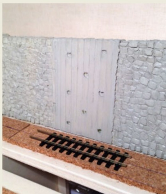
Gute Anregung für Abwechslung im Mauerwerk.