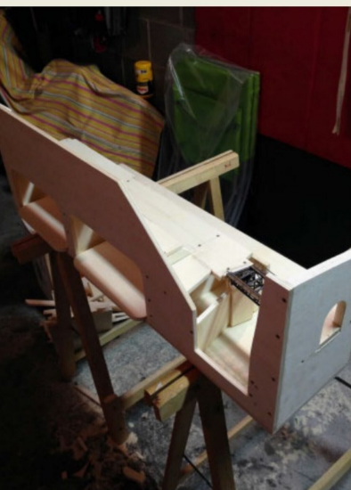
Rückwand verleiht dem Diorama Stabilität.