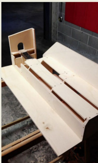
Vorne die im Text erwähnte (Barbaresco-)Auflage.