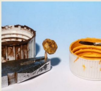
Mit gelber und brauner Farbe wird es grundiert.