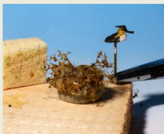
Stolzer Kerl: Der Haubentaucher ist «geschnitzt».