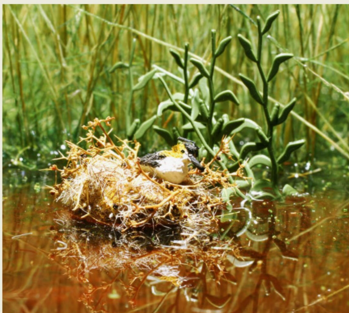
Seht mich an: Mein Schwimmest hat man einfach auf die Seefläche an den Schilfgürtel geklebt!

Material nach seinem Ableben vom Markt verschwunden. In beeindruckenden Dioramen zeigte er die erstaunlichen Anwendungsmöglichkeiten des Wassergestaltungswerkstoffes. Im Gegensatz zum bekannten Gießharz handelte es sich hierbei mehr um eine Art flüssigen Kunststoff. Rund acht Stunden benötigte das Gemisch aus zwei Komponenten zum Aushärten. Nach gut vier Stunden konnte man mit einem von Wolfgang E. Gauch entwickelten Silikon-Wellenstempel wunderschöne Wellenmuster in die spiegelglatte Oberfläche drücken, Strudel mit einem Stäbchen modellieren oder ein Angler hat am Waldweiher als Folge des zuckenden Schwimmers an der Angelschnur kreisrunde Wellen zu sehen