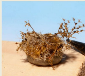
Meerschaumästchen werden einfach eingesteckt.