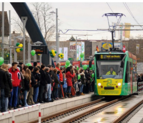
Am 14. Dezember herrschte anlässlich der Eröffnungsfahrten ein riesiges Gedränge an der Endhaltestelle, welche über den Gleisen des Bahnhofs Weil am Rhein liegt.