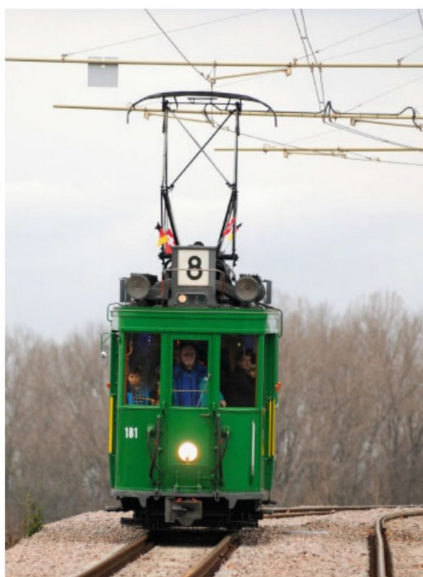
Auf Extrafahrt: Motorwagen Be 2/2 mit der Nummer 181 kurz hinter der Endhaltestelle in Weil am Rhein.