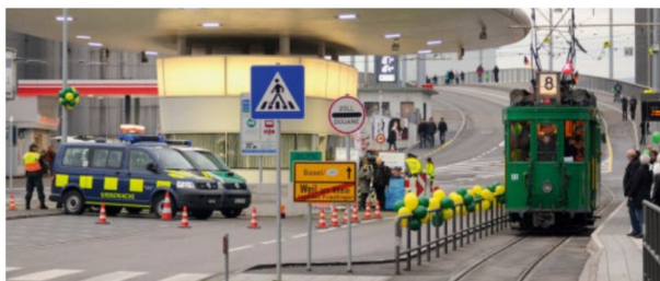
Steil geht es die Hiltalingerstrasse hinter dem Zoll hoch. Unter der im Zuge der Tramverlängerung neu errichteten Brücke befindet sich die Zufahrt für Schiffe zum Hafenbecken 2 des Basler Rheinhafens.