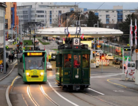
Neu gestaltet wurde der Grenzübergang Kleinhüningen/Friedlingen. Ge 2/2 215 stammt aus dem Jahr 1933 und wurde wie Motorwagen 181 durch die Schweiz. Industrie-Gesellschaft, Neuhausen (SIG) hergestellt.