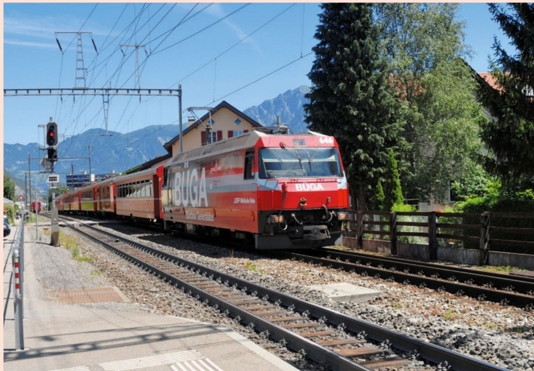
Ein Regionalexpress aus Chur mit Ziel St. Moritz fährt auf dem Dreischienenabschnitt in Domat/Ems ein.