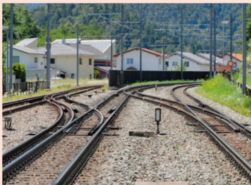
Das Pendant auf der Westseite des Bahnhofs Domat/Ems: Ausfahrt in Richtung Reichenau-Tamins und die Zufahrt zum Industriegebiet.