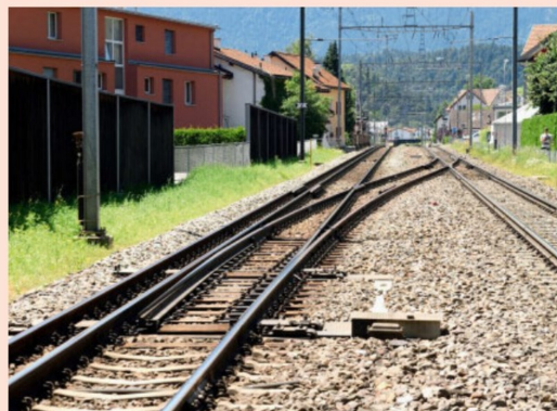
Die Bahnhofseinfahrt von Domat/Ems aus Richtung Chur mit dem Schmalspurabzweig zum zweiten RhB Streckengleis.

In der Ausfahrt vom Bf Domat/Ems Richtung Reichenau-Tamins zweigen Regel- und Schmalspur zu den ausgedehnten Industrieanlagen ab.