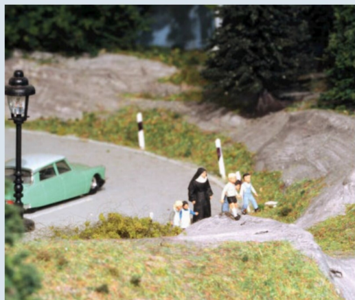
Franziskanerschwester Agnes auf dem Spaziergang mit ihren Schützlingen.