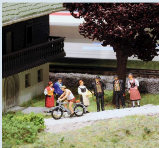
Familie Rütli hat sich fein gewandelt, in Thun findet heute das Stadtfest statt.